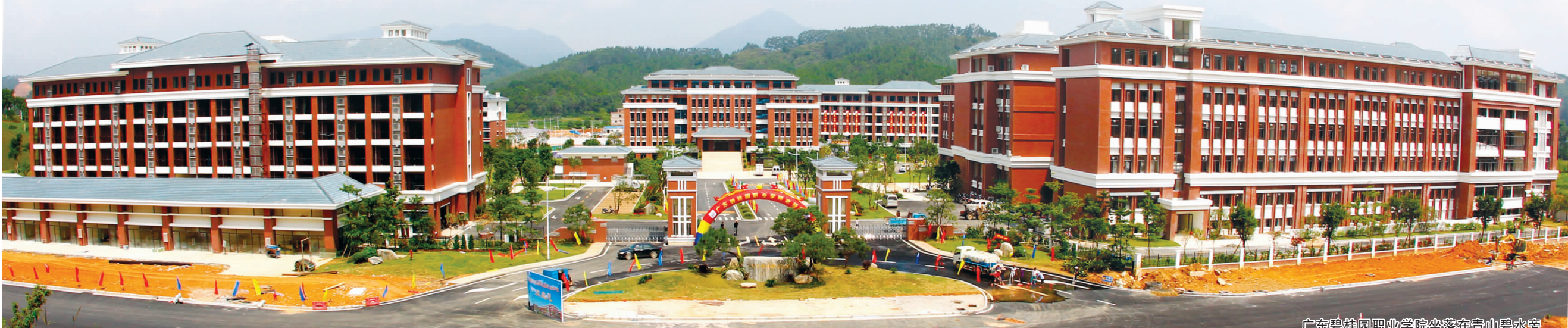
广东碧桂园职业学院坐落在青山绿水旁

升旗仪式是爱国主义教育的重要载体。我院自开展升旗仪式以来，得到了广大师生的积极参与和大力支持。通过升旗仪式，广大师生进一步增强了民族自豪感和国家荣誉感，激发了爱国热情和奋斗精神。今后，我们将继续深入开展爱国主义教育活动，引导广大师生坚定理想信念，勇担时代使命，为实现中华民族伟大复兴的中国梦而努力奋斗。