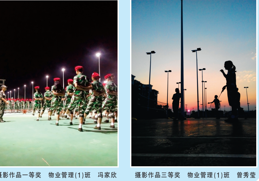
摄影作品一等奖 物业管理(1)班 冯家欣