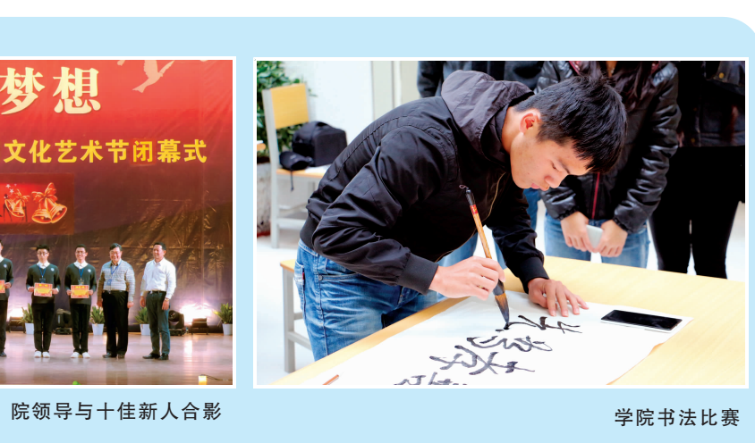
院领导与十佳新人合影

助公司一些热心人士的帮助，顺利地读上高中。第二次是高三那一年，高三的那个寒假，是我人生中过得最漫长最难忘和最无助的一个寒假。在这个假期里，最爱我的那个人走了，我最大的依靠没有了……曾经的我为了要成为爷爷奶奶的骄傲而发愤读书，为了让他们过上好的生活而努力，现在爷爷走了，我继续走下去的理由是什么？那一段时间，我什么都不想管，不想理，仿佛人生已没有了目标，当我在梦想与现实相徘徊时，是姑姑给了我前行的动力，她耐心又略带责备地跟我说：“都坚持了一年了，如果你现在放弃就真的什么都没了，你再努力一个学期就可以圆你的大学梦了，就这样放弃，值得吗？”恰逢一年一度的感恩节！总会让我想起许多帮助过我鼓励过我的人。因为我才得以走到今天，谢谢你们。我们每个人在成长过程中总少不了别人的帮助，我们的父母、爷爷奶奶、老师和朋友，许许多多给过我们鼓励和帮助的人都值得我们去感谢。怀一颗感恩之心生活吧！感恩挫折、感恩苦难、感恩贫穷，但它们让我们学会坚强，学会坚韧，磨练我们的意志和品格。 每个人都自己的梦想，或大或小，或平凡或伟大，但无论怎样，我们每个人都因追逐梦想而得到提升，因为梦想而不断完善自我。 只有把梦想带在身边，才会有更好的飞翔。也许不是每一个梦想都可以实现，但是每个梦想都会给你坚不可摧的力量。