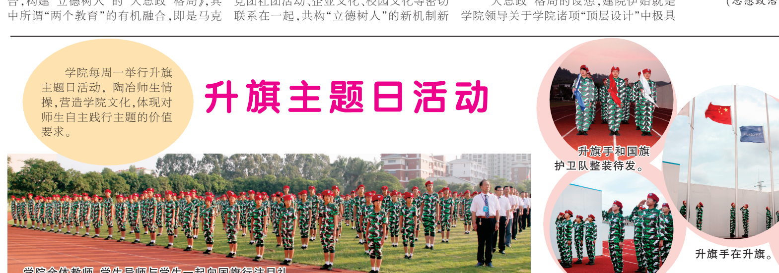
学院全体教师、学生导师与学生一起向国旗行注目礼